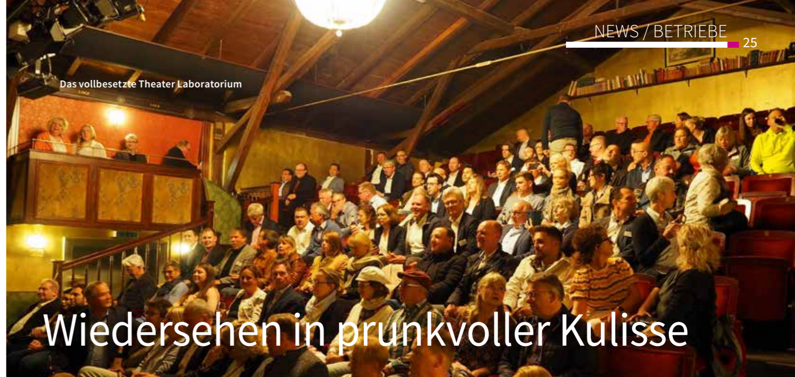
Das vollbesetzte Theater Laboratorium