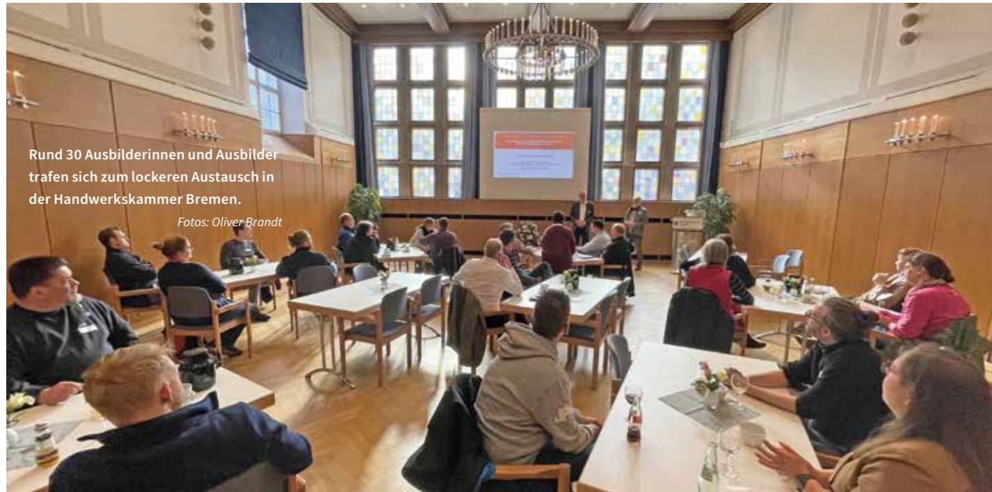
Rund 30 Ausbilderinnen und Ausbilder trafen sich zum lockeren Austausch in der Handwerkskammer Bremen.