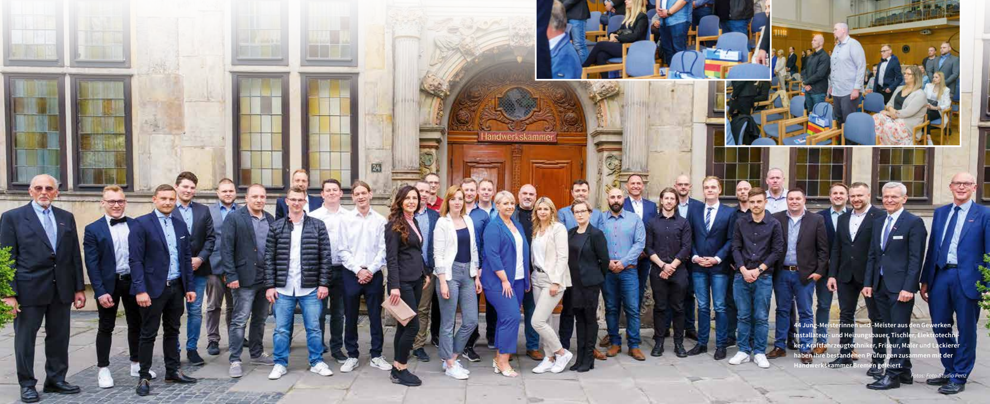
44 Jung-Meisterinnen und -Meister aus den Gewerken Installateur- und Heizungsbauer, Tischler, Elektrotechniker, Kraftfahrzeugtechniker, Friseur, Maler und Lackierer haben ihre bestandenen Prüfungen zusammen mit der Handwerkskammer Bremen gefeiert.