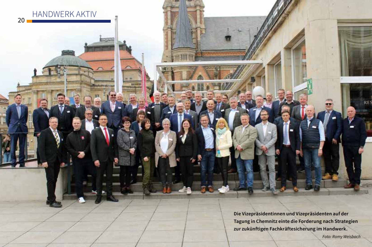
Die Vizepräsidentinnen und Vizepräsidenten auf der Tagung in Chemnitz einte die Forderung nach Strategien zur zukünftigen Fachkräftesicherung im Handwerk.