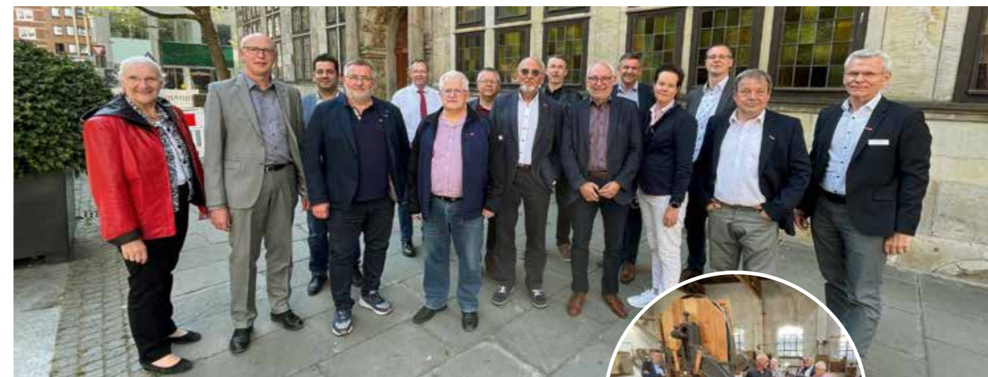
Im Gewerbehaus tauschten sich die Vorstände und Geschäftsführer der beiden Kammern Bremen und Braunschweig-Lüneburg-Stade über aktuelle Themen der Branche aus. Außerdem besuchten sie das Tischlerei-Museum Bremen.

Im Verlauf der Tagung sprachen die Teilnehmerinnen und Teilnehmer auch über zahlreiche weitere Themen, darunter auch das neue Verfahren zur Benennung von Arbeitnehmermitgliedern für Prüfungsausschüsse über die Gewerkschaften.